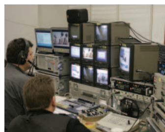
Herbol TV-Regieraum: Alles im Blick.