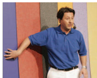
Diego Velazquez: Beton muss nicht grau sein.