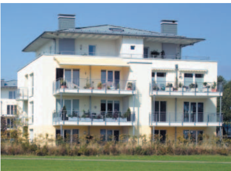
Herbol-Herbosilit-Außensilikat: Nur ein Egalisationsanstrich war nötig.

Eine natürliche Lösung: Mineralisch matte Fassadenoptik mit Herbol-Herbosilit-Außensilikat