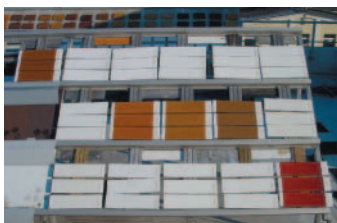
Die Farbstabilität wird über viele Jahre in Freibewitterungsständen geprüft.

■ Klimaveränderungen wie die Abnahme der Ozonschicht, die erhöhte UV-Belastung und andere Umwelteinflüsse stellen auch neue Anforderungen an Farbtöne bei Fassadenfarben. Denn das Ausbleichen und die Verwitterung von Farbtönen schreiten schneller voran als je zuvor. Deshalb ist es für jeden Maler wichtig, dass er Fassadenfarben einsetzt, die mit höchst lichtbeständigen Pigmenten getönt werden. Sonst kann es gerade bei kritischen Farbtönen vorkommen, dass der Farbton des Gebäudes nach Jahren ganz anders aussieht. Damit hat der Malerbetrieb ein Gewährleistungsproblem, das mit hohen Kosten verbunden ist. Herbol hat mit dem neuen Tönkonzept MineralColor innovative, malergerechte Farbtöne entwickelt, die farbstabil sowie licht- und wetterecht sind. Das führt zu einem optimalen, zukunftssicheren Schutz bei farbigen Fassaden.