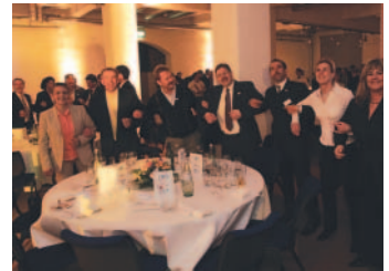
Ausgelassenes Feiern und gemeinsames Singen des FSB-Hits.