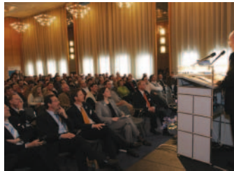
Interessante Fachvorträge im Kleinen Auenaal.

Der Informationsprospekt zum Herbol-Fassaden-Schutzbrief können Sie mit dem beiliegenden Faxblatt bestellen.