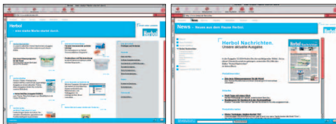
Die Herbol-Internetseite ist voll und ganz auf die Bedürfnisse des Malers eingestellt.

■ Die Herbol-Website wird täglich von unzähligen Malerprofis angeklickt – und das aus gutem Grund. Auf www.herbol.de finden Sie als Maler interessante News, wichtiges Produktwissen und ausführliche Hintergrundberichte kompakt aufbereitet. Sogar das renommierte Malerblatt war im Website-Test vom Herbol-Auftritt begeistert. „Die Website ist ein Lehrbeispiel, wie man ein riesiges Informationsangebot übersichtlich darstellen kann.“ Der Herbol-Internetauftritt unterteilt sich in sechs Bereiche: Produkte, News, Service, Objekte, Bibliothek und Kontakt. Im Bereich „Produkte“ haben Sie Zugriff auf alle Herbol-Produkte unter der bekannten Farbkennung, mit praktischer Suchfunktion sowie allen Technischen Merkblättern, die Sie auch downloaden können. Aktuelles bei Produkten, Messen sowie die kompletten Ausgaben von Herbol-Nachrichten und Herbol-Infoplus sehen