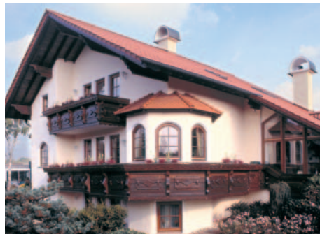
Stillmix aus Märchenschloss und bayerischem Landhaus: das „Kaminhaus“ der Familie Grewing nach der Renovierung mit Herbol.

Die Termine für die nächsten Herbol-Wandtage finden Sie im Internet unter www.herbol.de . Die Broschüre zu den innovativen Herbol-Innenwandfarben können Sie über das beiliegende Faxblatt anfordern.