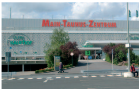
Optimal geschützt: die Fassade des Main-Taunus-Zentrums.

Taunus-Zentrums heute in einem dekorativen und wetterbeständigen Finish – zur Begeisterung von Bauleitung, Betreibergesellschaft und Kunden.