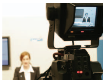
Achtung Aufnahme: Herbol TV-Nachrichten.