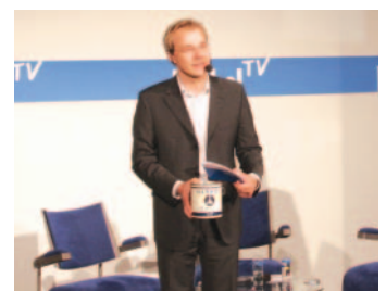
Der Moderator fragt: „Seit wann gibt es Herbol?“