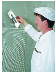
Zur Stabilisierung wird das Herbol-Armierungsgewebe eingezogen.

Der Untergrund muss fest, sauber, tragfähig, trocken und frei von Ausblühungen, Algen, Moosen etc. sein. Dabei erzieht der Herbol-Fassadenreiniger, ein zuverlässig wirkendes, wassererdünnbares Spe-