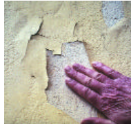
Prüfung kreiender Flächen durch Wischprobe.

forderlich, ob man es mit Wärmedämmverbundsystemen, mineralischen Altbeschichtungen, Kunstharzbeschichtungen oder anderen zu tun hat. Der Fachmann muss zu dem erkennen, ob es sich um Verschmutzungen, Algen oder Moos oder bestimmte Rissarten handelt.