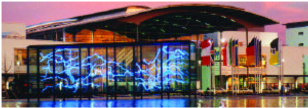
Mehr als 400 Aussteller locken die Besucher auf die Farbe 2002 in München.

Herbol trägt den neuesten Farbtrends Rechnung und stellt seine Farbtönenkollektion „Farbe und Architektur“ vor. Dem Maler steht dadurch ein praxisgerechter breiterer Gestaltungsspielraum bei der Farbauswahl zur Verfügung. Mehr darüber erfahren Sie auf dem Herbol-Messestand in Halle B2.