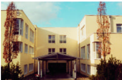
Das Bonner Verwaltungsgebäude strahlt nach der Renovierung in neuem Glanz.